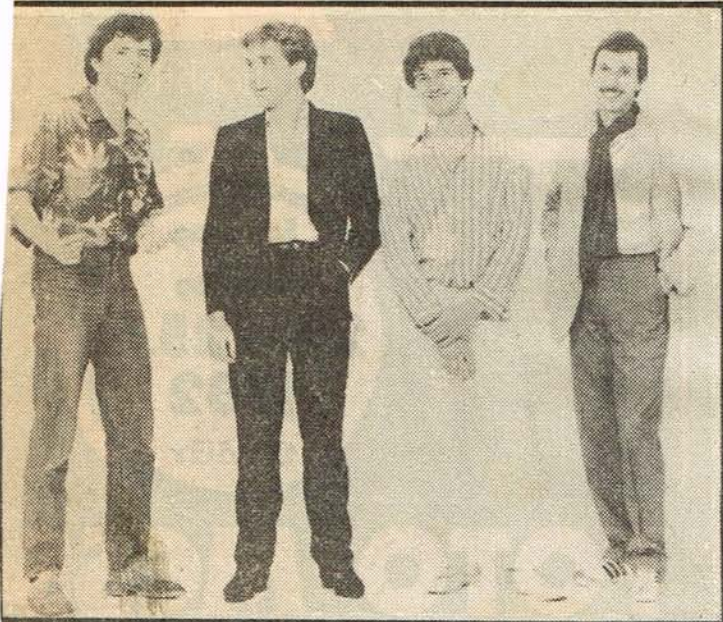
* De Frank Boeyen Groep.