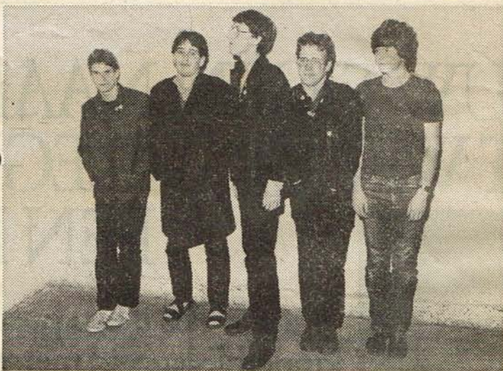
* Alternative Buttons

Deze keer zijn de New Wave-formaties Alternative Buttons uit Obbicht en de Skinheads uit Geleen aan de beurt. De entree is gra-