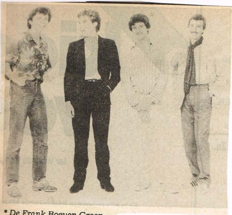
* De Frank Boeyen Groep